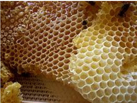
Natürlicher Wabenbau von Bienen