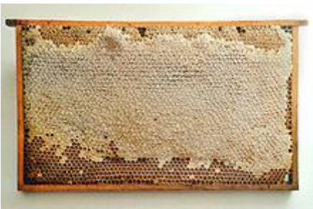
Fast vollständig verdeckelte und schleuderreife Honigwabe