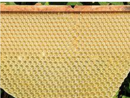
Ausgebaute Mittelwand mit Arbeiterinnenzellen (oben-kleiner) und frei gebaute Drohnenzellen (unten-grösser)